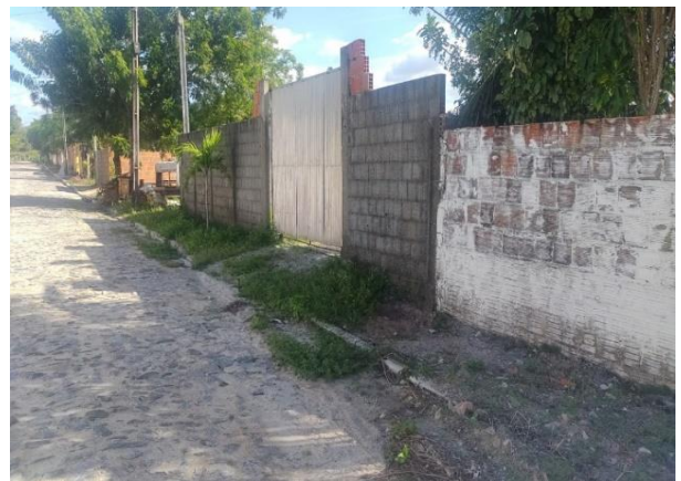
Avaliando - vista 02