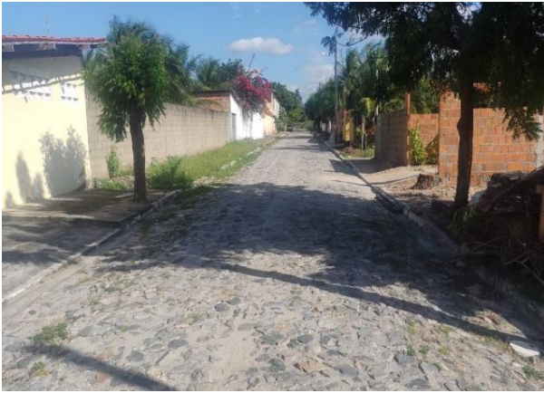
Logradouro - vista 01