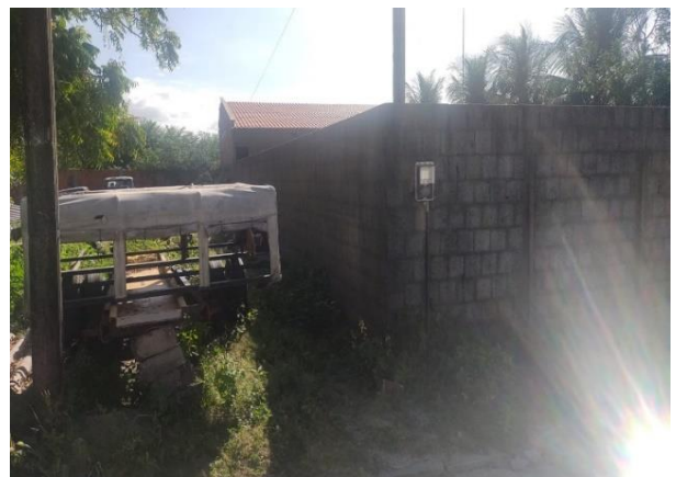
Medidor de energia