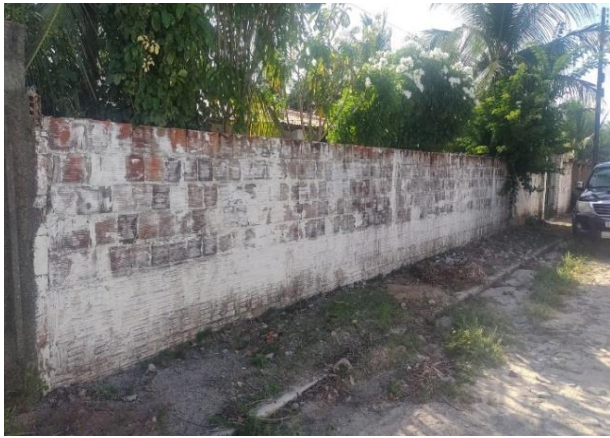
Vizinho à direita