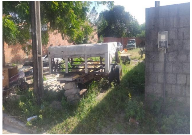
Vizinho à esquerda 01