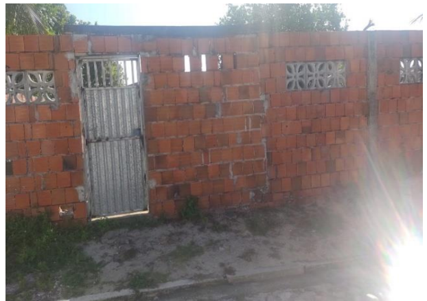
Vizinho à esquerda 03