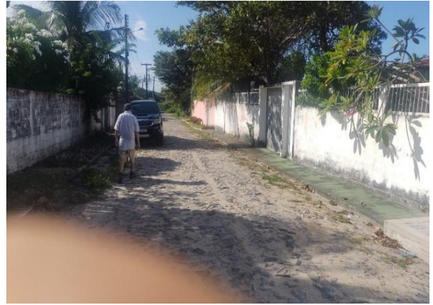
Logradouro - vista 02