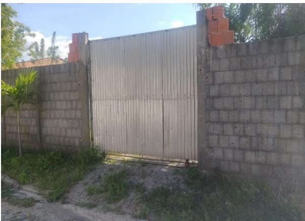
Avaliando - vista 01