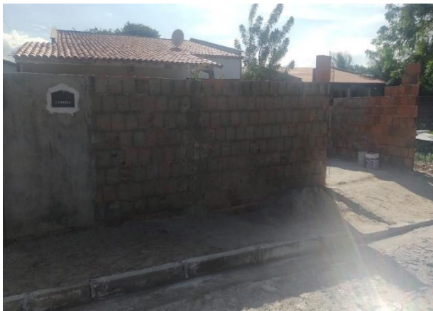
Vizinho à esquerda 02