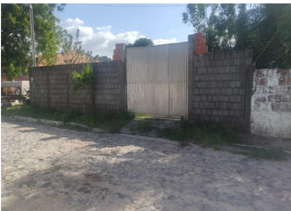
Avaliando - vista 03