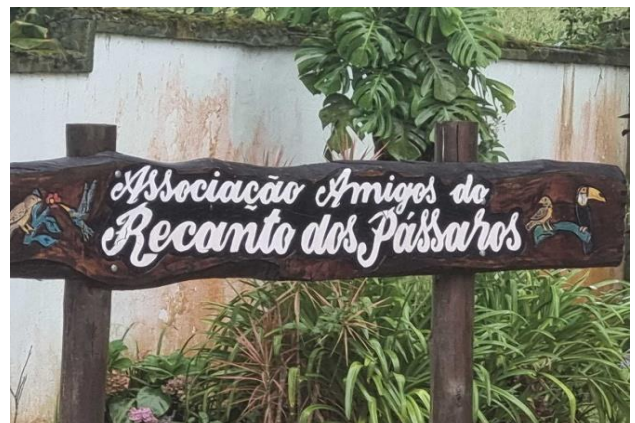
Identificação do condomínio