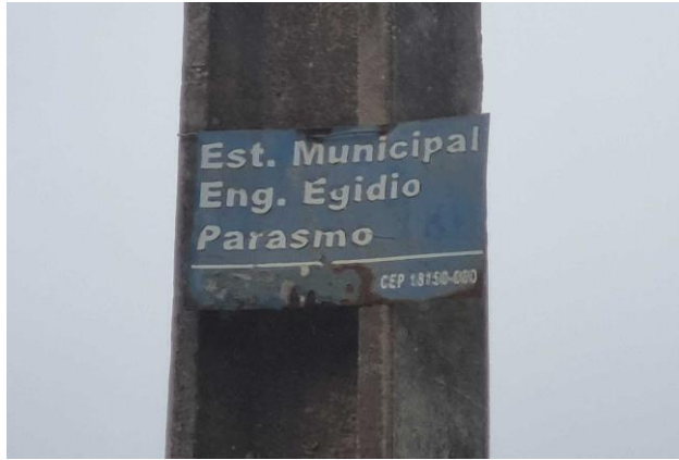
Identificação do logradouro