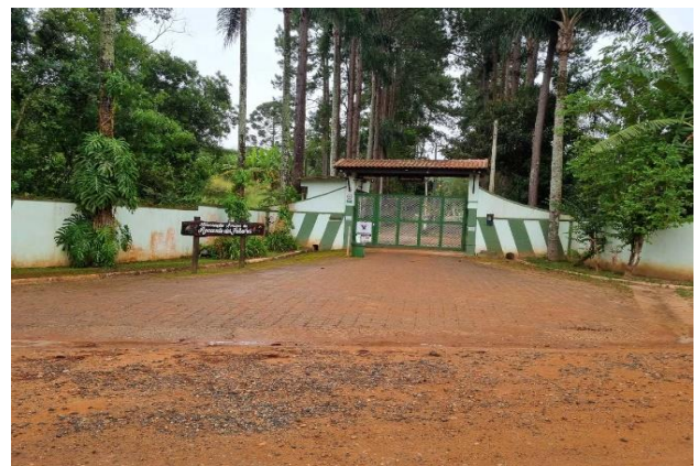
Fachada do condomínio - Vista 02