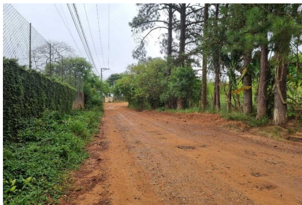
Estr. Municipal Eng. Egidio Parasmó - Vista 02