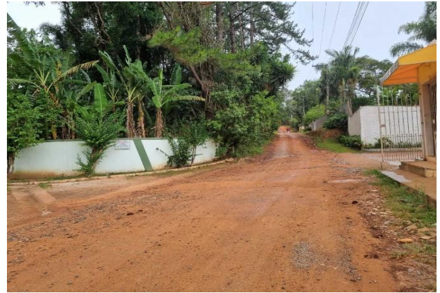
Estr. Municipal Eng. Egidio Parasmó - Vista 01