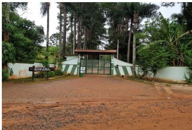
Fachada do condomínio - Vista 01