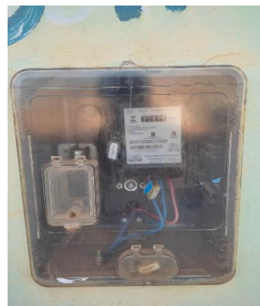
Medidor de energia