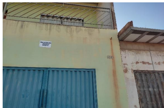
Identificação do avaliando