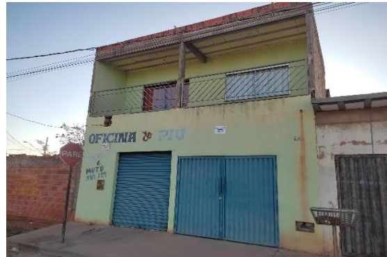
Fachada do avaliando