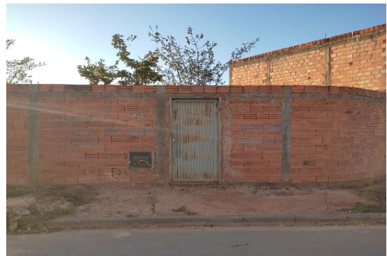
Identificação do vizinho à esquerda