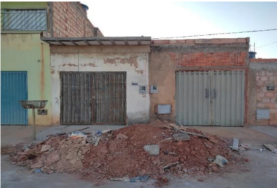
Vizinho à direita