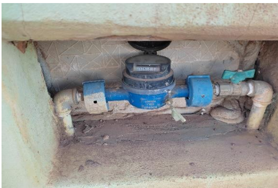
Medidor de água