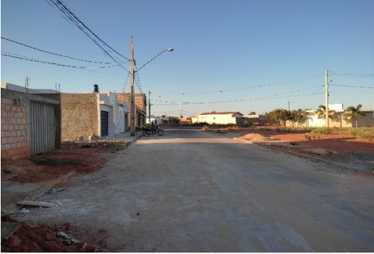
Logradouro à direita