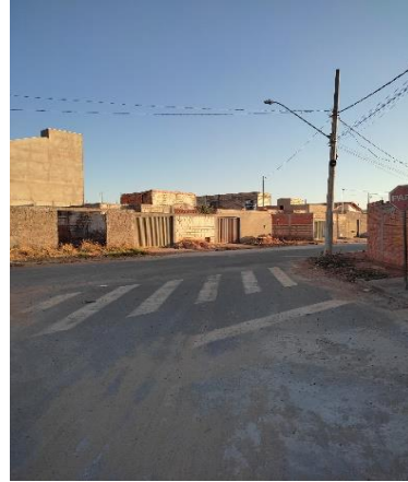
Logradouro à esquerda