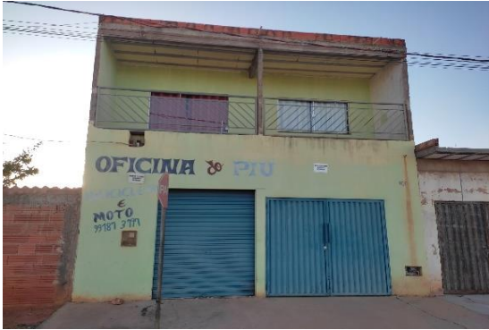
Fachada do avaliando