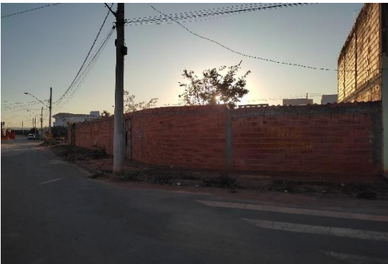
Vizinho à esquerda