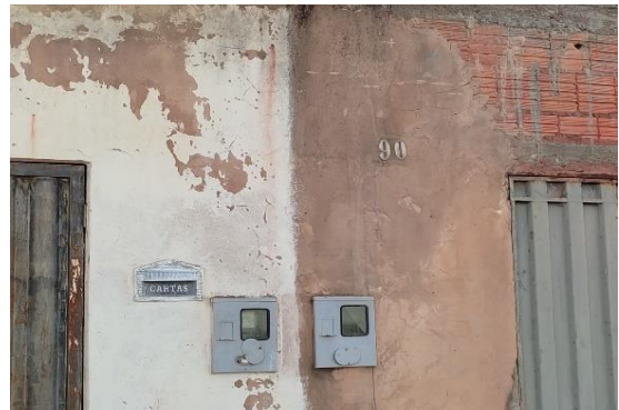
Identificação do vizinho à direita