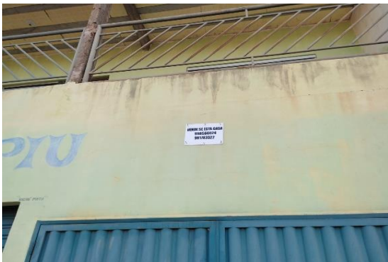
Identificação do avaliando