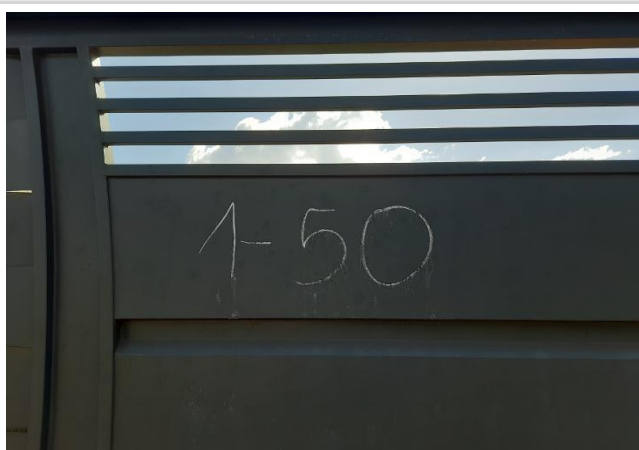
Identificação do avaliando