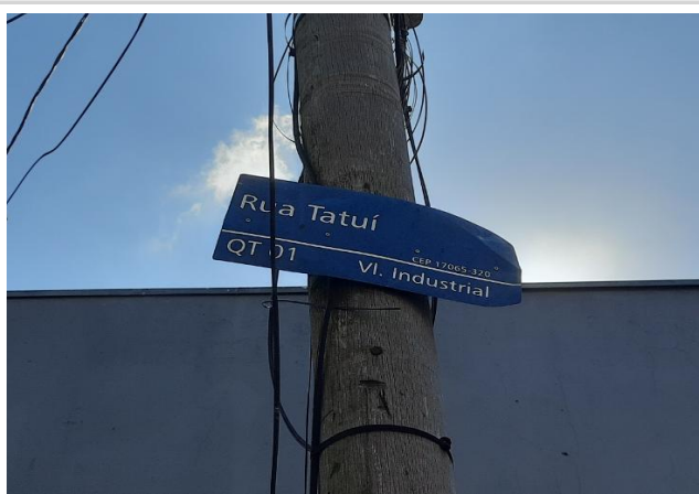
Identificação da via