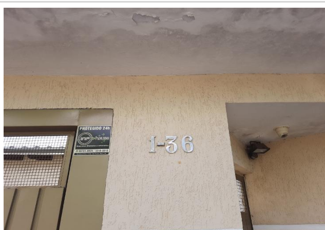
Vizinho à direita - Identificação