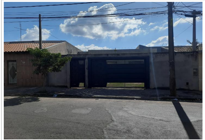
Fachada do avaliando