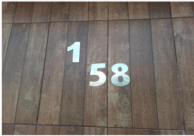
Vizinho à esquerda - Identificação