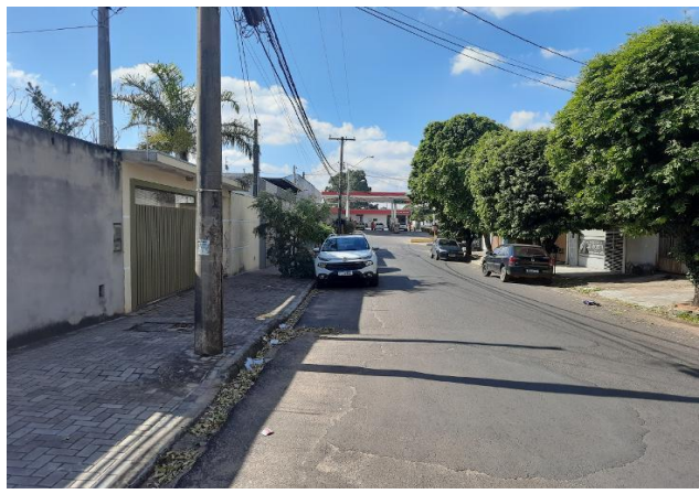
Rua Tatuí, vista 01