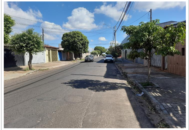
Rua Tatuí, vista 02