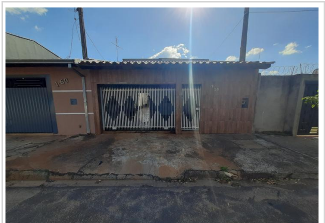
Vizinho à esquerda - Fachada