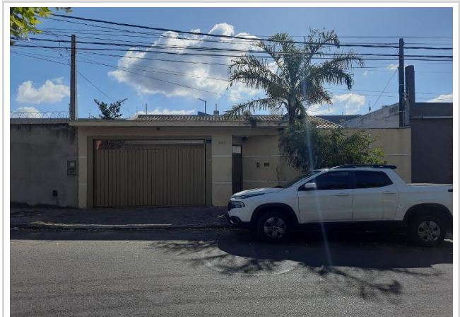
Vizinho à direita - Fachada