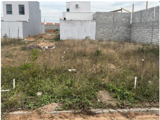
VISTA DO LOTE