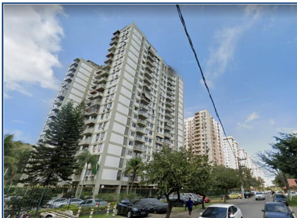
Fachada do condomínio