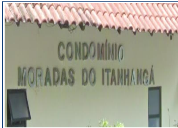
Identificação do condomínio