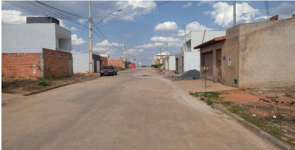
Logradouro à direita