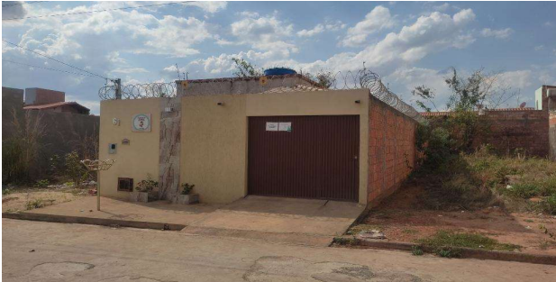
Fachada do avaliando