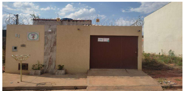
Fachada do avaliando