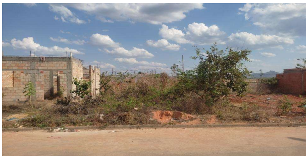
Vizinho à frente