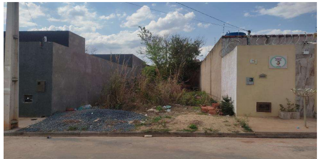
Vizinho à esquerda