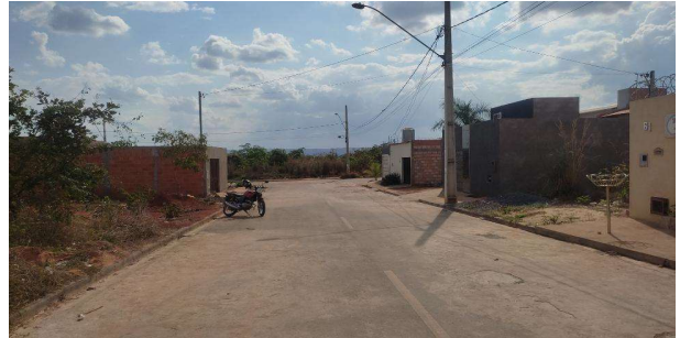
Logradouro à esquerda