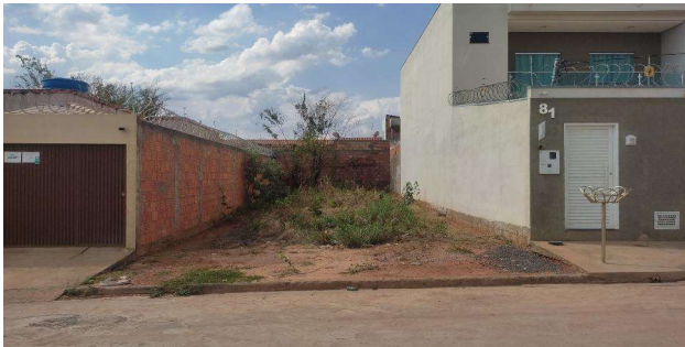
Vizinho à direita