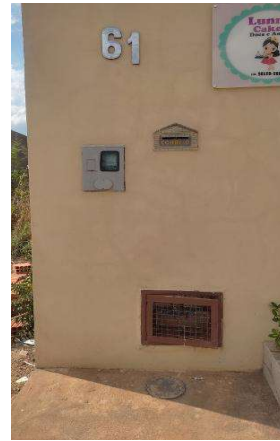
Identificação do imóvel