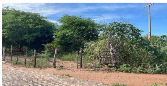
Fachada do avaliando