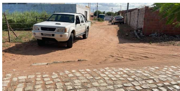
Logradouro 02 - Vértice 03