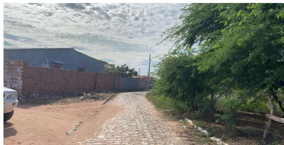
Logradouro 01 vista 02 - Vértice 03