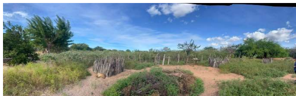
Vértice 4 e 5