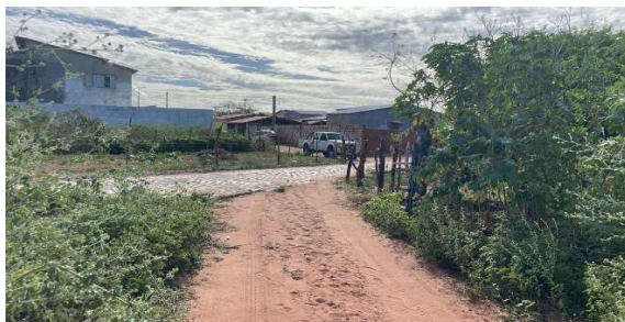
Acesso ao vértice 3