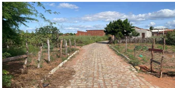
Logradouro 01 vista 01 - Vértice 03