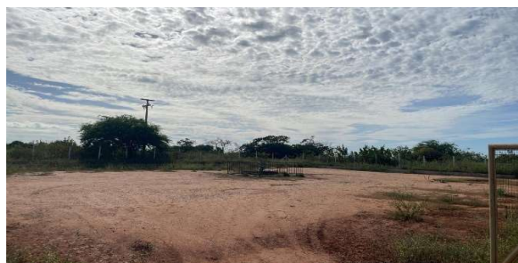
Poço de petróleo entre o vértice 3 e 2