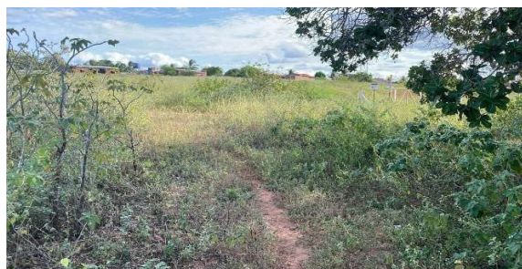
Estrada de acesso ao vértice 2