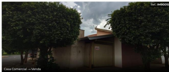
Casa Comercial → Venda

Jardim Alto do Ouro Verde, Borborema - SP