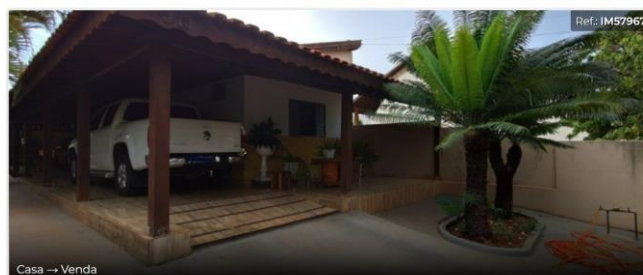
Casa → Venda

Imprimir Enviar por e-mail Solicitar ligação Adicionar aos favoritos