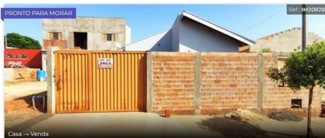
Casa → Venda

Jardim Alto do Ouro Verde, Borborema - SP