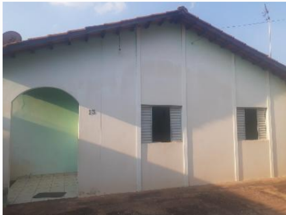
IDENTIFICAÇÃO DO IMÓVEL