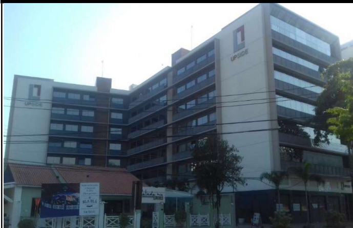
Foto Portaria/Frente do imóvel