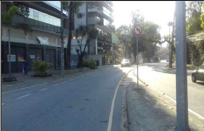
Foto Logradouro 1

Comentários: VISTA DIREITA RUA ARAGUAIA.