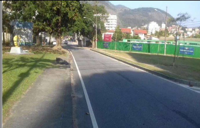
Foto Logradouro 2

Comentários: VISTA ESQUERDA RUA ARAGUAIA.