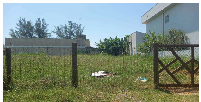
Vizinho à esquerda