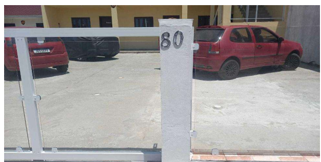
Vizinho frontal - Identificação