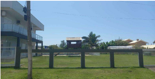
Fachada avaliando - Vista 03