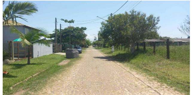
Logradouro - Vista 02