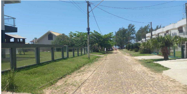
Logradouro - Vista 01