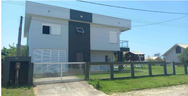
Fachada avaliando - Vista 01