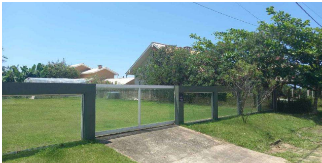
Vizinho à direita