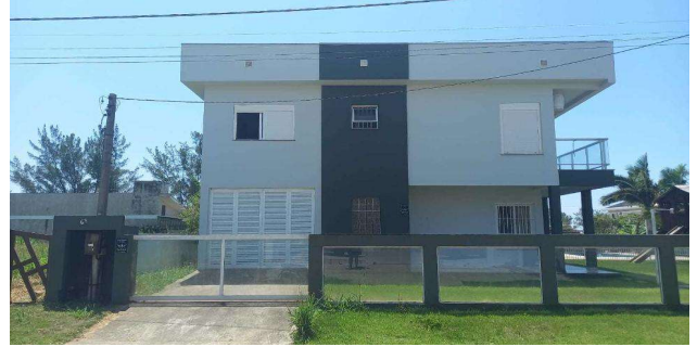
Fachada avaliando - Vista 02