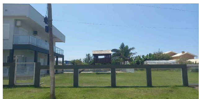
Fachada avaliando - Vista 04