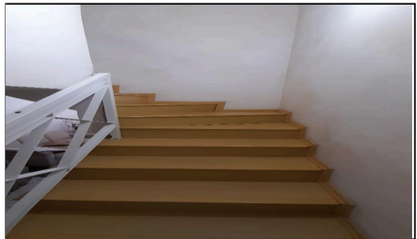
Descrição: VISTA PARCIAL ESCADA