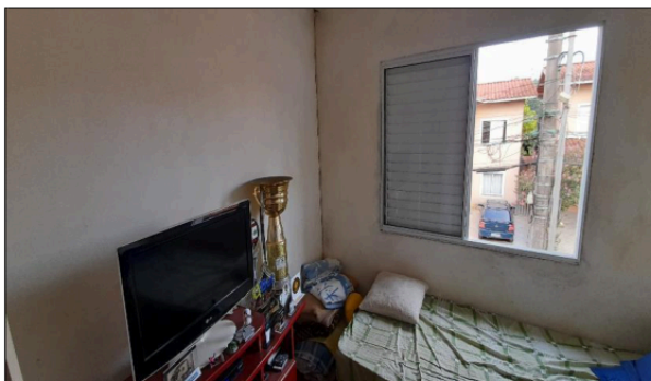
Descrição: VISTA PARCIAL DORMITÓRIO