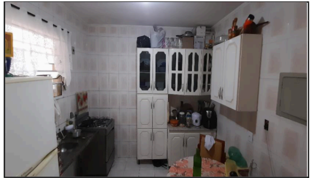
Descrição: VISTA PARCIAL COZINHA