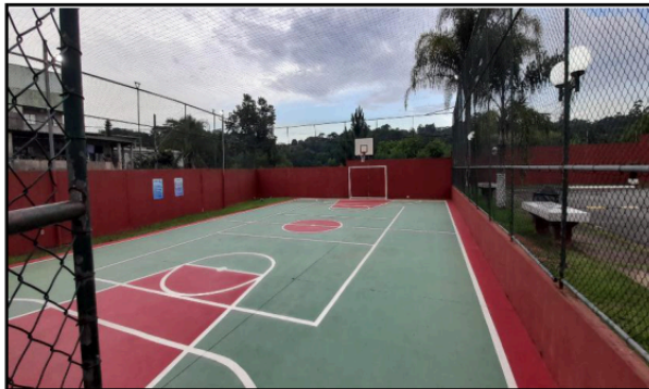
Descrição: ÁREA COMUM DO CONDOMÍNIO