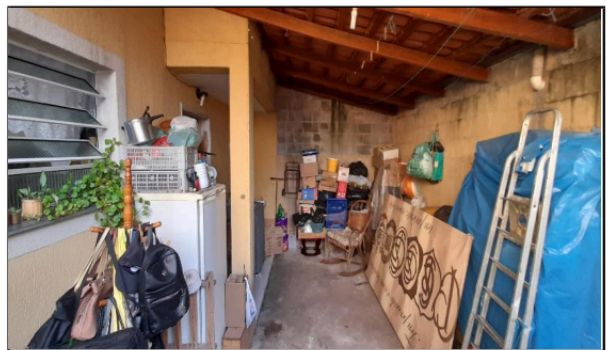
Descrição: VISTA PARCIAL VARANDA