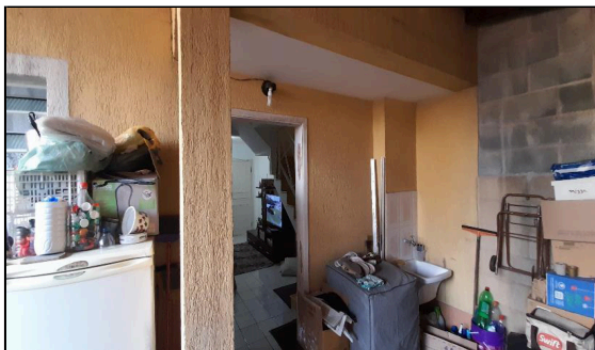
Descrição: VISTA PARCIAL ÁREA DE SERVIÇO