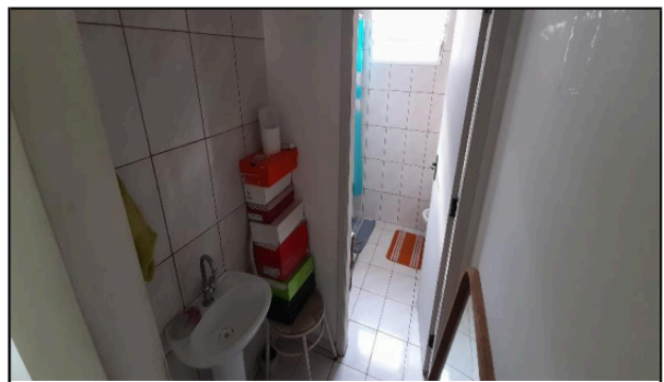
Descrição: VISTA PARCIAL WC SOCIAL