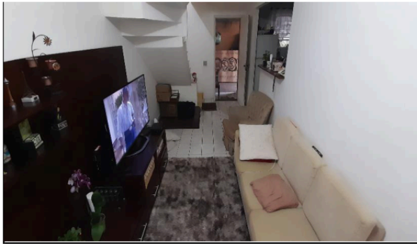
Descrição: VISTA PARCIAL SALA ESTAR