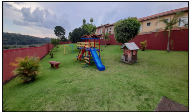
Descrição: ÁREA COMUM DO CONDOMÍNIO