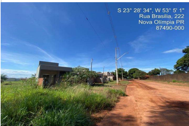
Logradouro - Vista 05