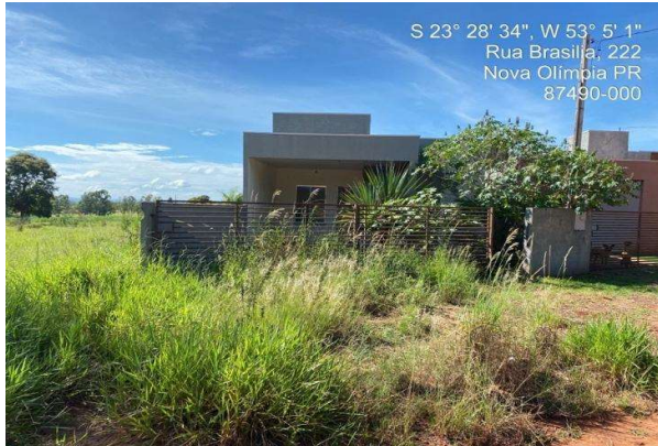
Fachada avaliando - Vista 02