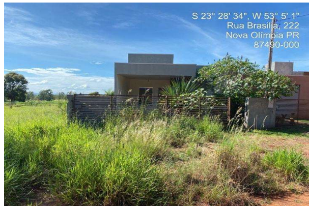
Fachada avaliando - Vista 01