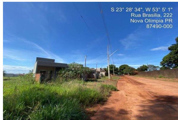
Logradouro - Vista 04