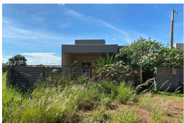
Fachada avaliando - Vista 03