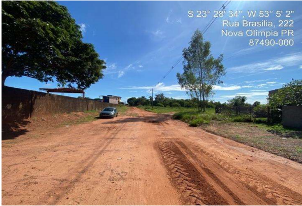
Logradouro - Vista 01