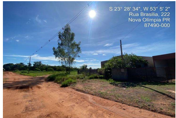
Logradouro - Vista 02