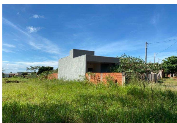
Fachada avaliando - Vista 05