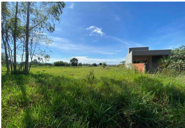
Vizinho à esquerda