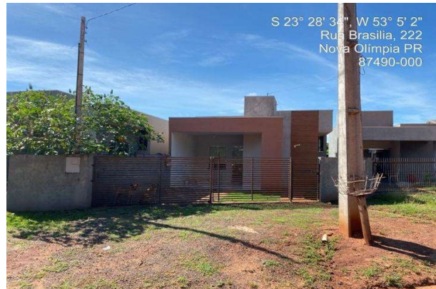
Vizinho à direita