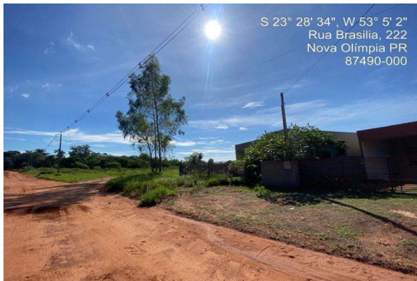
Logradouro - Vista 03