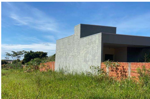
Fachada avaliando - Vista 04