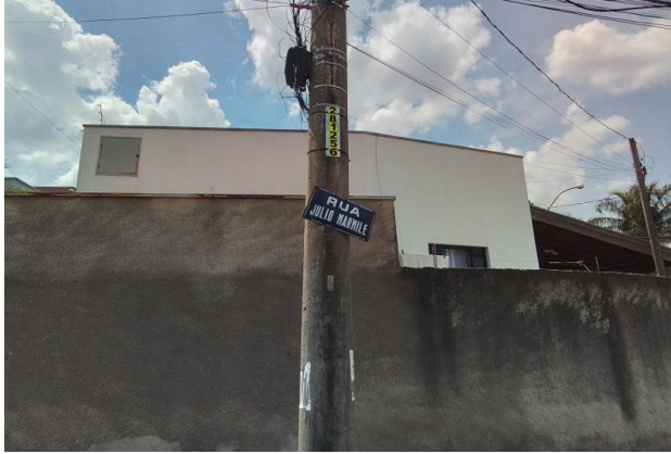
Identificação do logradouro