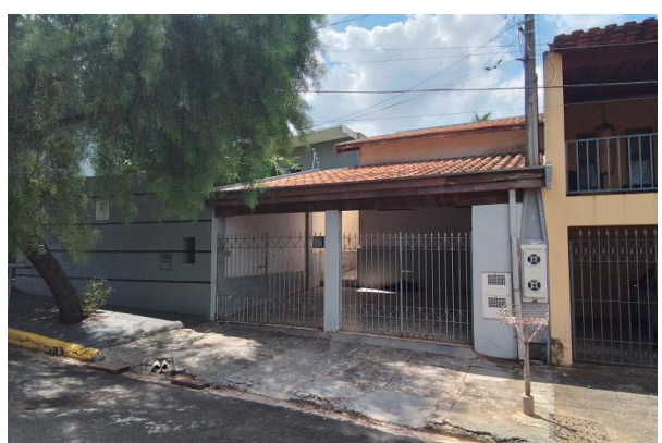
Fachada avaliando - Vista 01