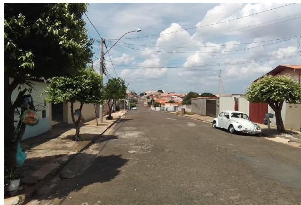
Logradouro - Vista 02