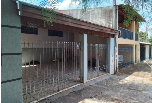
Fachada avaliando - Vista 02