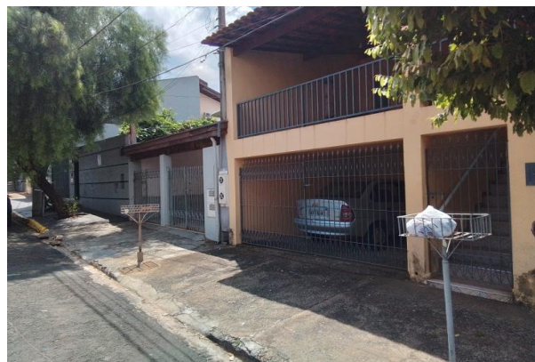
Vizinho à esquerda