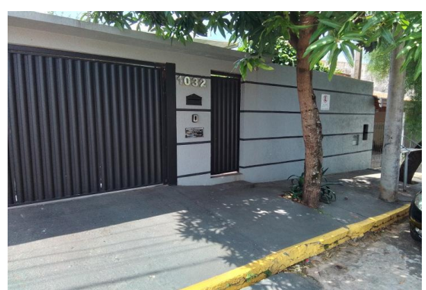
Vizinho à direita