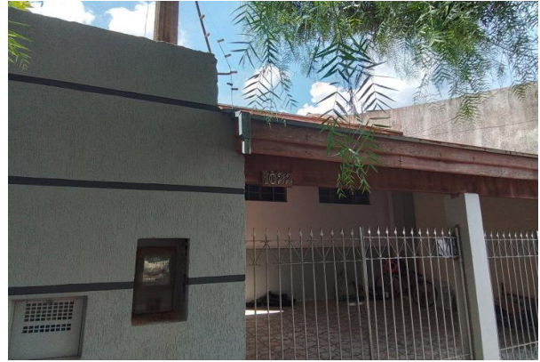
Identificação do avaliando