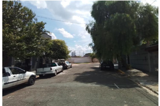
Logradouro - Vista 01