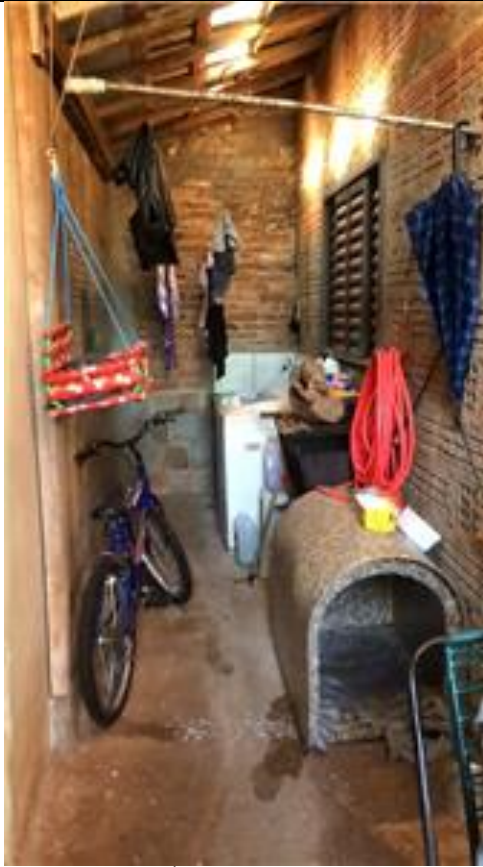
Área de serviço