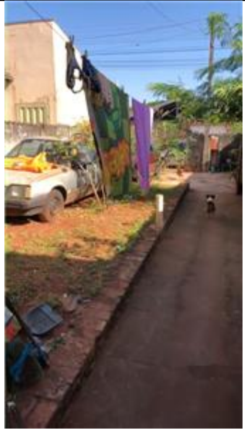
Garagem / quintal frontal