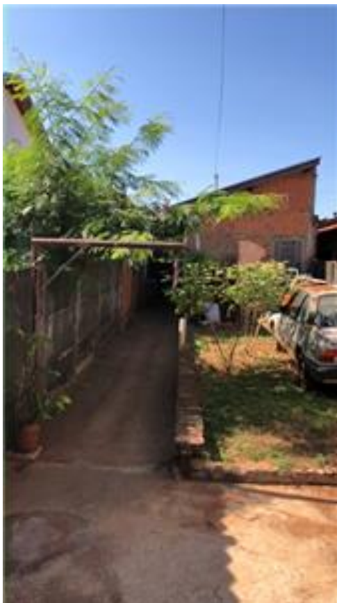
Garagem / quintal frontal