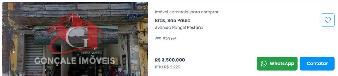
Elemento Comparativo 2