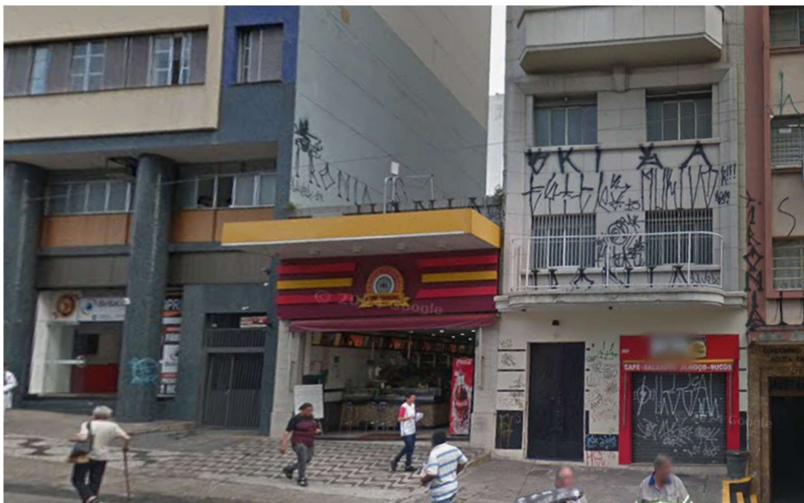
Figura 1 - Fachada do imóvel