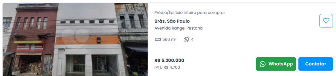
Elemento Comparativo 3