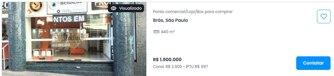
Elemento Comparativo 1