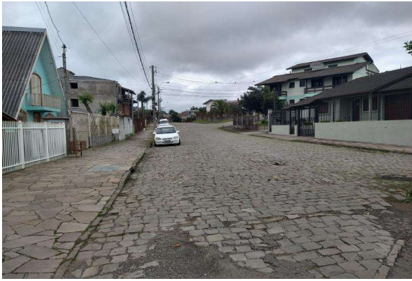
Logradouro - Vista 01