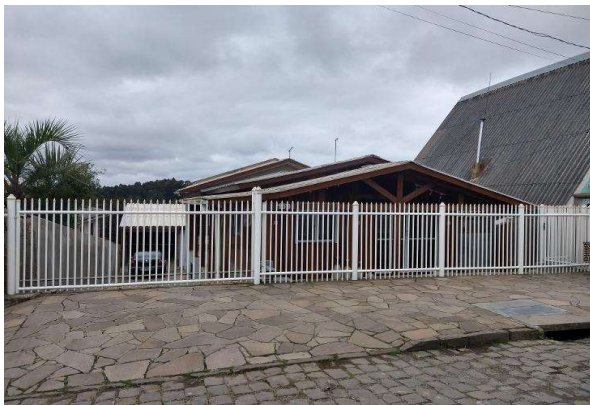
Vizinho à esquerda