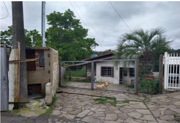
Fachada avaliado - Vista 02