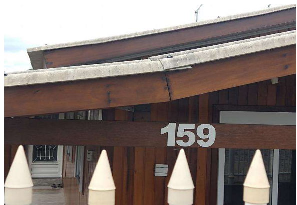
Vizinho à esquerda - Identificação