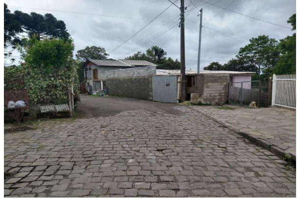
Logradouro - Vista 02