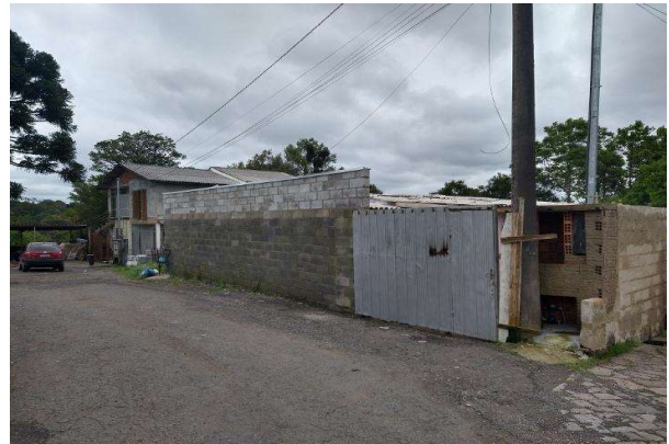
Vizinho à direita