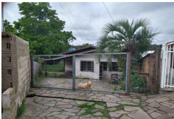
Fachada avaliada - Vista 06