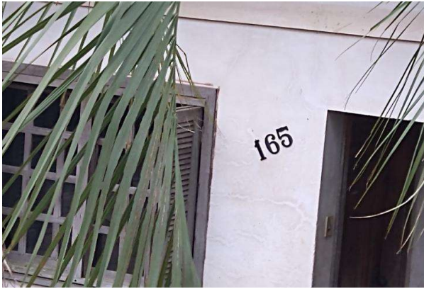
Identificação do avaliado