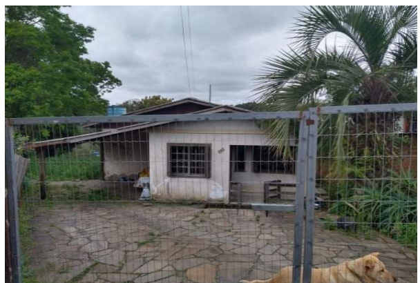
Fachada avaliado - Vista 05