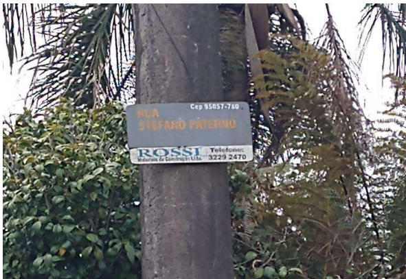
Identificação do logradouro