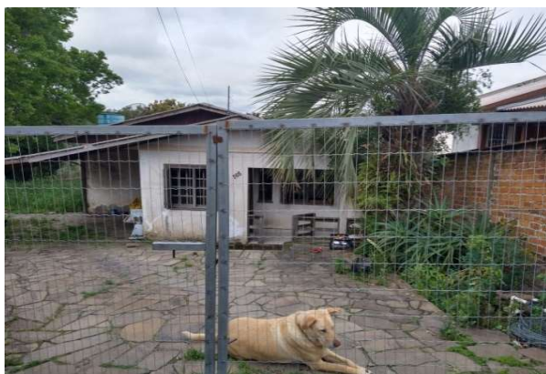
Fachada avaliado - Vista 04