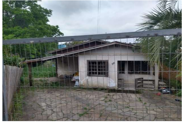
Fachada avaliado - Vista 01