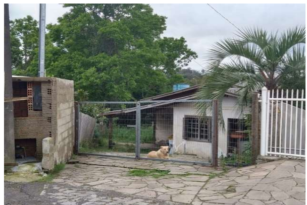
Fachada avaliado - Vista 03