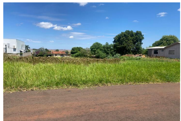
Vizinho à esquerda - Lote 22A