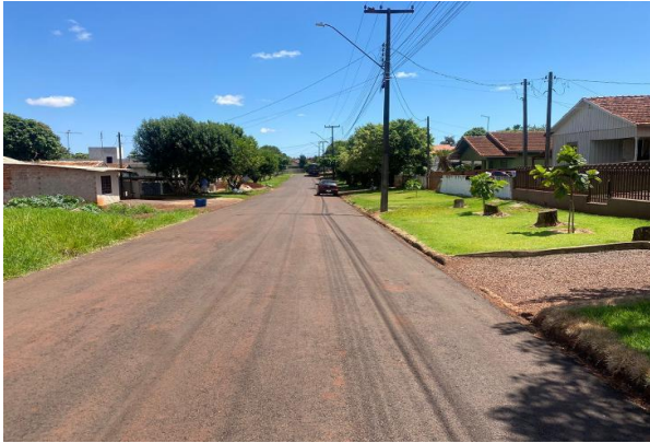
Logradouro - Vista 01