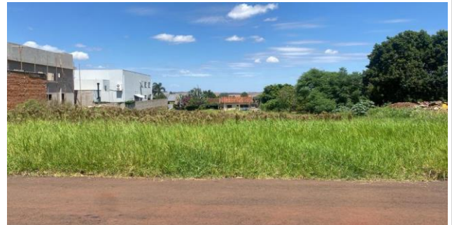
Fachada avaliando - Lote 22 - Vista 01