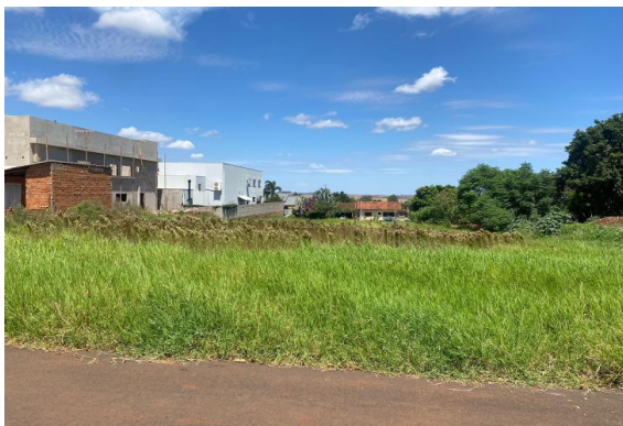
Fachada avaliando - Lote 22 - Vista 02