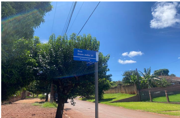
Identificação do logradouro