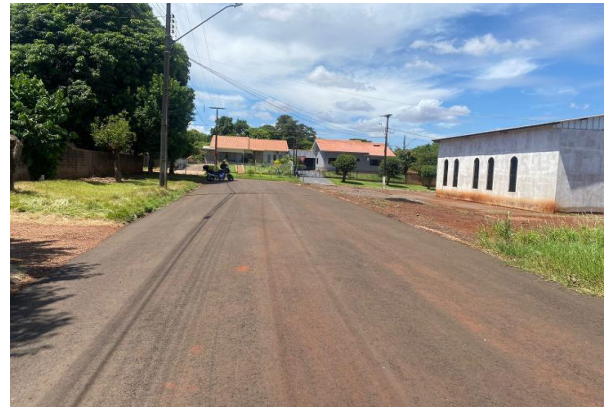
Logradouro - Vista 02