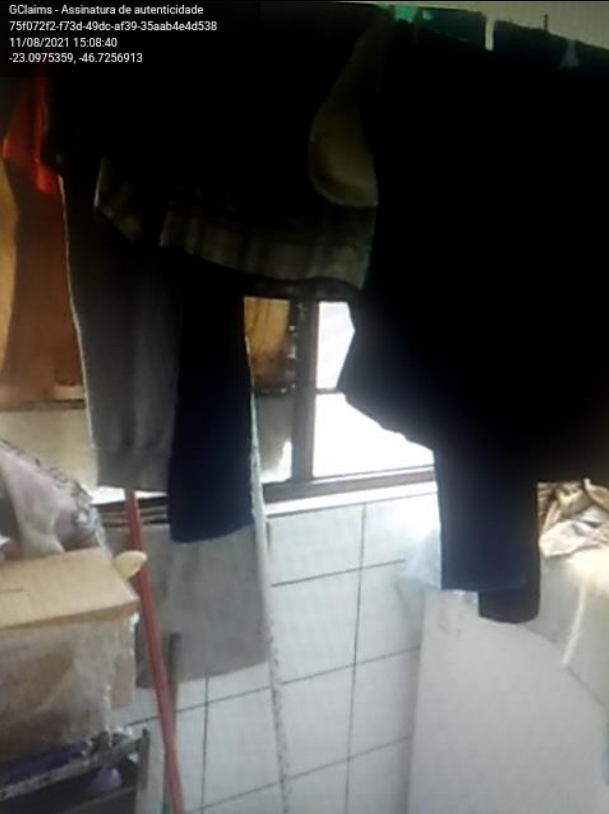
Área de Serviço

GClaims - Assinatura de autenticidade 75f072f2-f73d-49dc-af39-35aab4e4d538 11/08/2021 15:08:40 -23.0975359, -46.7256913