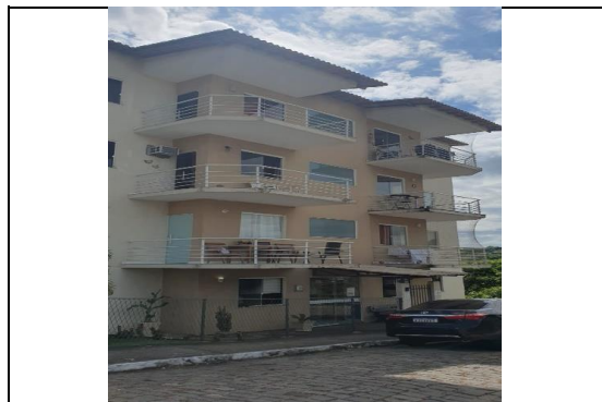
FACHADA DO CONDOMÍNIO