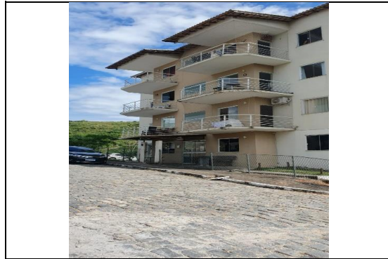
FACHADA DO CONDOMÍNIO