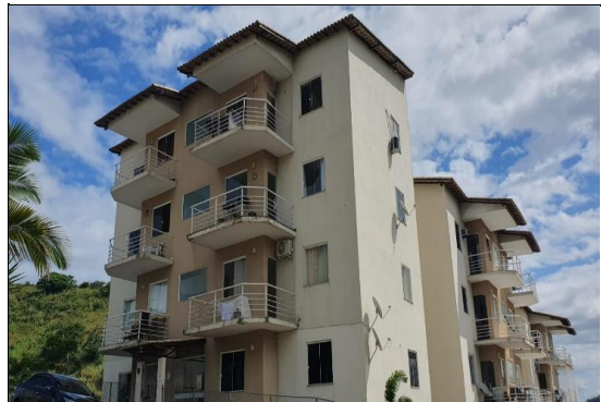
FACHADA DO CONDOMÍNIO