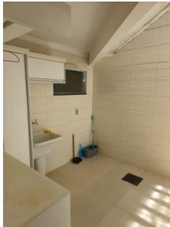
ÁREA DE SERVIÇO