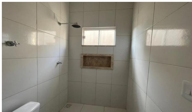
Descrição: BANHEIRO SUÍTE