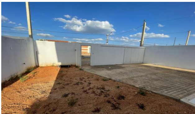
Descrição: ENTRADA DO IMÓVEL/ GARAGEM