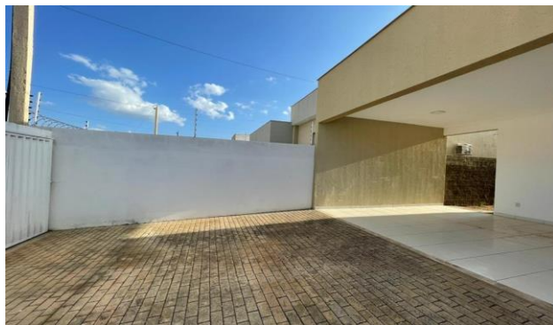
Descrição: ENTRADA DO IMÓVEL/ GARAGEM