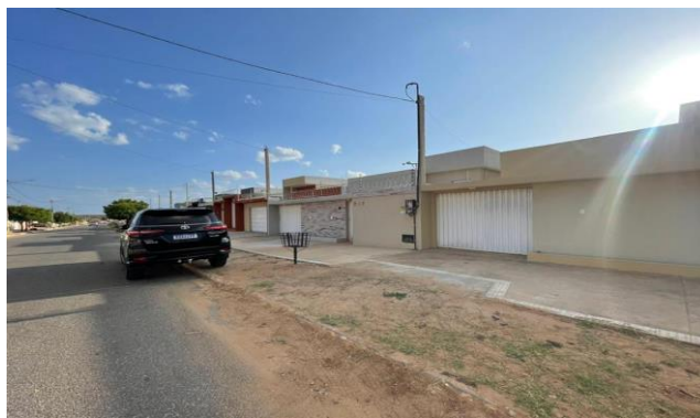
FOTO DA FRENTE DO IMÓVEL