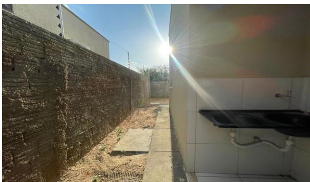
Descrição: ÁREA DE SERVIÇO