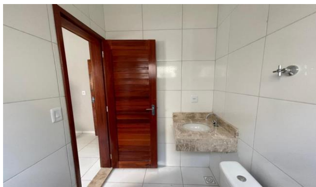
Descrição: BANHEIRO SOCIAL